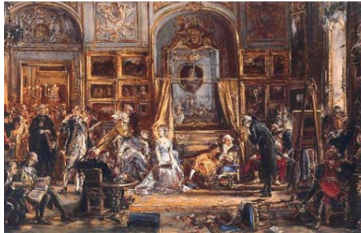
Sejm Wielki, pędzlem Jana Matejki

Upadek państwa polskiego sprawił, że zmiany mentalne następowały znacznie wolniej niż w innych krajach. Kształtowanie świadomości narodowej pośród wszystkich stanów, stało się jednak faktem. Przejaw tego zjawiska uwidocznił się najdobitniej w czasie wielkich powstań narodowych, w tym w szczególności - styczniowego (1863-1864).