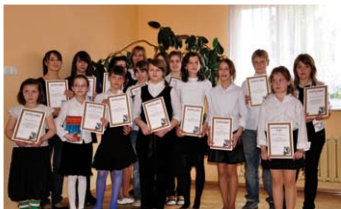
Uczestnicy konkursu recytatorskiego