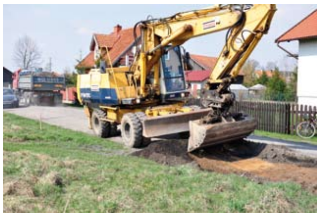
Wymiana gruntu na drodze w Porbadach