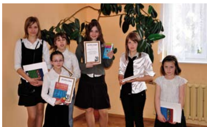
Laureaci konkursu recytatorskiego

Szanowni Druhowie Ochotniczych Straży Pożarnych z terenu Gminy Jonkowo