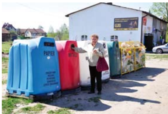
Mieszkańcy Jonkowa już segregują śmieci

Z okazji zbliżającego się Dnia Strażaka, składam Druhom z OSP Jonkowo, OSP Wrzesina, OSP Szafstry, OSP Mątki i OSP Węgajty, najserdeczniejsze życzenia zdrowia i pomyślności.