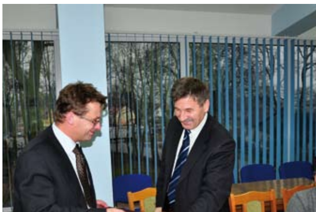
Podpisane umowy z wykonawcą