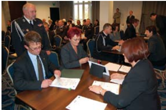
Podpisanie umowy finansowej

W czwartek 29 października w Olsztynie odbyła się uroczystość podpisania umów finansowych w ramach Osi 6 - Środowisko Przyrodnicze Regionalnego Programu Operacyjnego Warmia i Mazury na lata 2007-2013. Ze środków tych przewidziany jest zakup specjalistycznych wozów strażackich.