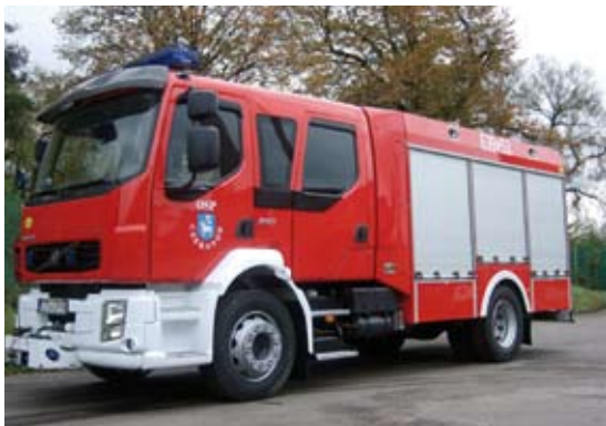
Tak będzie wyglądał nowy pojazd

go, typu 1239AF o mocy 286 KM (210 kW), z napędem 4 x 4, zbiornikiem wody 2500 l (kompozyt) i środka pianotwórczego 250l., szybkim natarciem dł. 60 m z prądownicą wysokociśnieniową, działkiem wodno-pianowym typ DWP 8/16. Ponadto samochód wyposażony będzie w: Układ wodno-