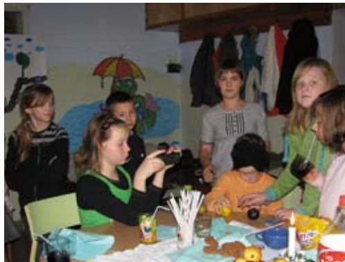
Andrzejki w świetlicy w Jonkowie

filizanek, które odwrócone do góry dnem skrętnie ukrywały przyszłość. Obrączka – zamażpójście lub ożenek, moneta – bogactwo a krzyżyk – powołanie. Kram z owocami również się podobał, dzieci z zasłoniętymi oczami miały do wyboru trzy różne owoce; jabłko wróżyło miłość, cy-