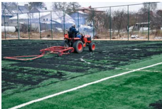
Wysypywanie gumowego granulatu na sztuczną trawę

W zaprojektowanym dla Gminy Jonkowo kompleksie sportowym powstanie boisko do piłki nożnej z nawierzchnią z trawy syntetycznej o wielkości 30x62m (pole gry: 26x56m), boisko wielofunkcyjne do siatkówki lub koszykówki z nawierzchnią poliuretanową o wymiarach 19,1x32,1m (pole gry: 15,1x28,1m). Dodatkowo około 65m 2 zajmie zaplecze dla sportowców składające się z budynków wyposażonych w szatnie, łazienki, magazyny oraz pomieszczenia dla trenerów. Wraz z budową Orlika zostanie również zagospodarowany i uporządkowany teren wokół obiektów. Całość kompleksu otrzyma ogrodzenie z siatki metalowej.