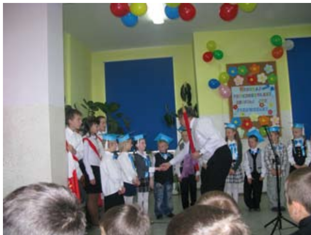
Pasowanie na ucznia w SP Wrzesina