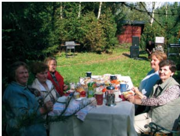
Wypoczynek po grzybobraniu