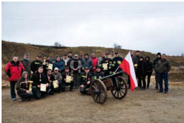
Uczestnicy II Zawodów Strzeleckich

wśród startujących. Przy gorącej gronchówce trwały zagorzałe dyskusje, kto lepiej strzelał i dlaczego tak trudno było