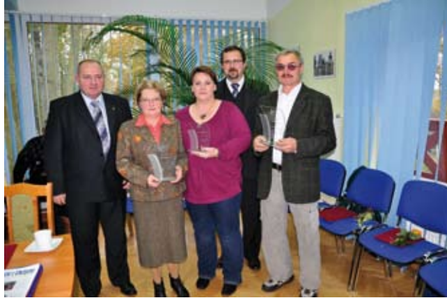
Laureaci tegorocznej edycji

na których mieszkańcy zaprezentowali swoje osiągnięcia w wielu dziedzinach (kulinarne, rękodzielnicze, artystyczne, etc.).