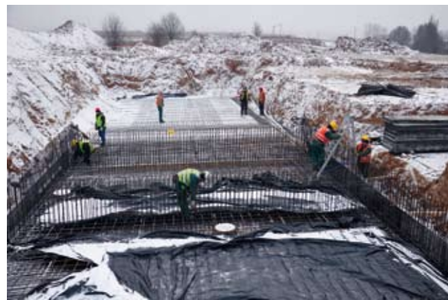
Prace na placu budowy

Drodzy Mieszkańcy Gminy Jonkowo Boże Narodzenie to czas, by przesłać wszystkim najserdeczniejsze życzenia miłości i radosnych chwil spędzonych w gronie rodziny.